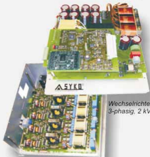
Wechselrichter 3-phasig, 2 kVA